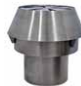
Chimenea / Chimney Ref. 759.013

* Este horno tiene la posibilidad de ser utilizado con múltiples accesorios. El límite lo pone la habilidad e imaginación del chef. En caso de ser utilizado en exteriores se recomienda usar la chimenea completa.