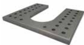
Atemperador / Warming Tray Ref. 920.040