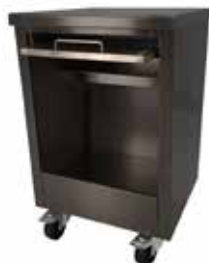
Mesa / Table Ref. 770.240 (Lux) Ref. 770.340 (Silver)