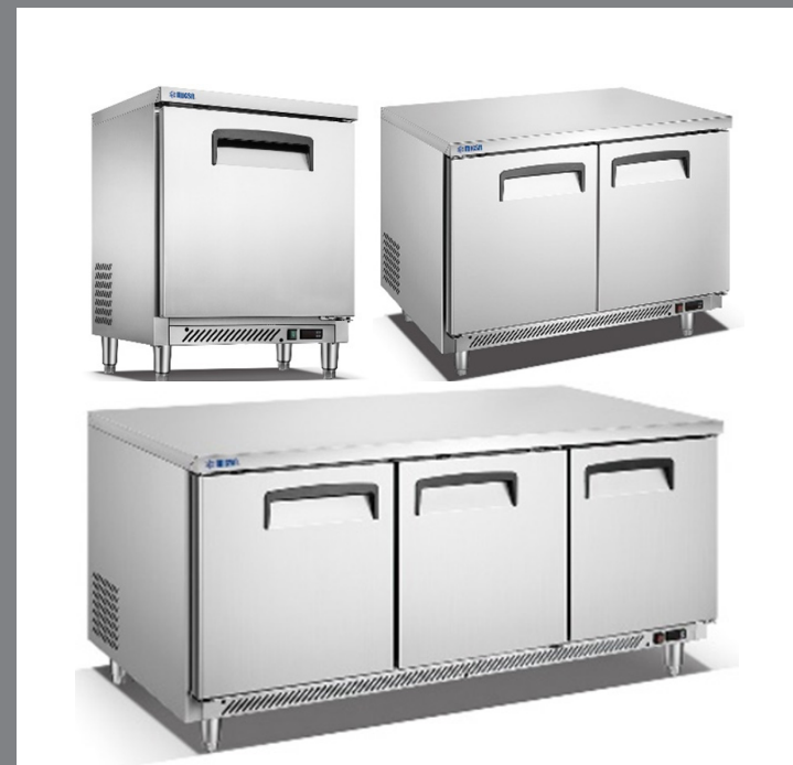
MODELOS UC-27F-1 | UC-48F-2 | UC-72F-3

MAQUINARIA INTERNACIONAL GASTRONÓMICA, S.A. DE C.V. 📍 HENRY FORD 257-H, COL. BONDOJITO, ALC. G.A.M. 07850, CDMX. ☎ 5517.4771 | 5739.3423