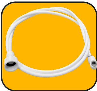
Manguera larga 152 cm de 1/4" con codo y conector hembra de 3/4"