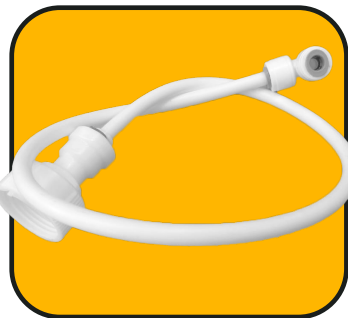
Manguera corta 54 cm de 1/4" con codo y conector hembra de 1"