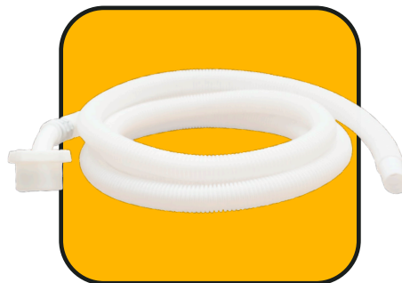
Manguera de desagüe 2 m de 1/2" con conector