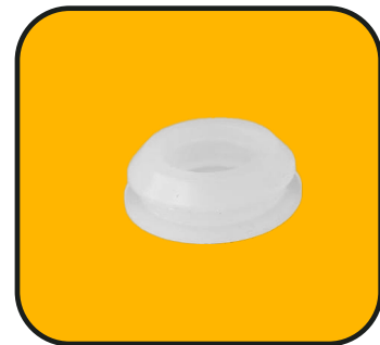
Tapón de depósito de agua