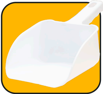
Pala de plástico