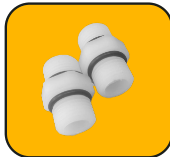
2 coples de 1/2"