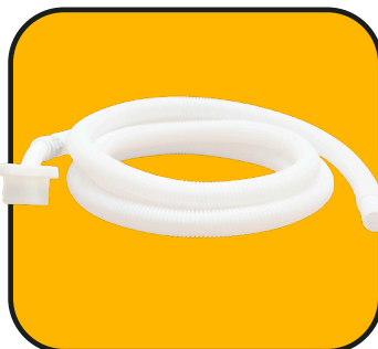
Manguera de alimentación 2.5 m con conectores de 1" y 3/4"