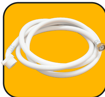
Manguera de desagüe 2 m de 1/2" con conector