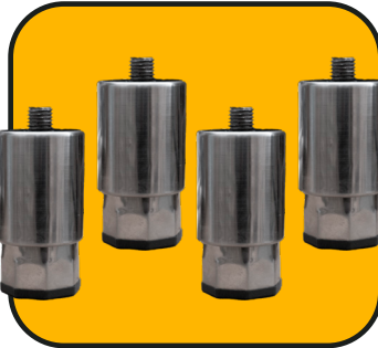
4 patas ajustables