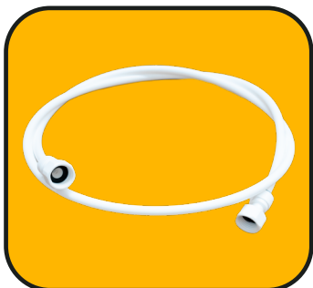
Manguera con dos conectores de 3/4"