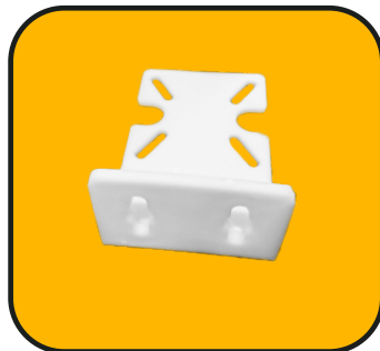
Soporte de plástico y 4 pijas