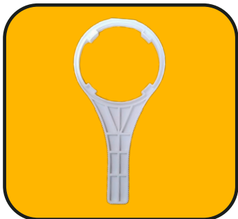
Llave para filtro