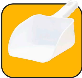
Pala de plástico