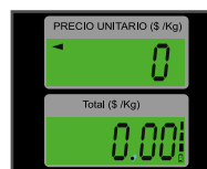
Pantallas de cuarzo con iluminación (backlight)