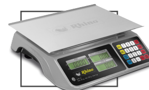
Incluye mica protectora