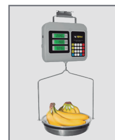
Ideal para verdulerías y recauderías