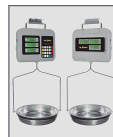
Pantallas para usuario y cliente con iluminación