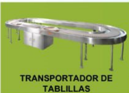
TRANSPORTADOR DE TABLILLAS