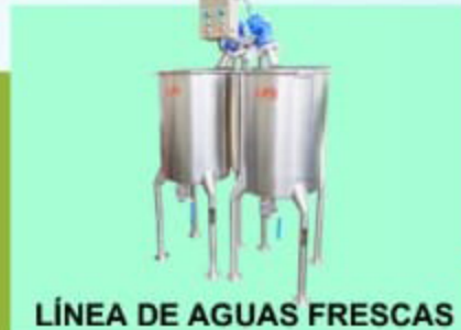
LÍNEA DE AGUAS FRESCAS