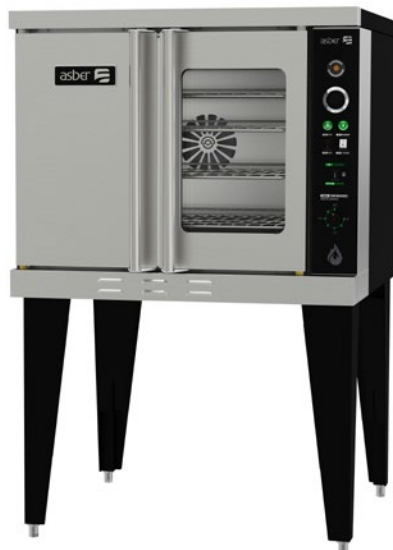
AECO 1 E